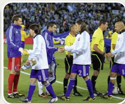
Die Profis machen es vor: Das Abklatschen ist Zeichen der respektvollen Begegnung